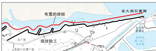
图2 黄河花园口段护根排桩平面布置示意图

档处,从工程线型整体平顺和走向美观考虑对排桩位置线进行外移平顺布置,花园口段护根排桩平面布置示意图见图2。